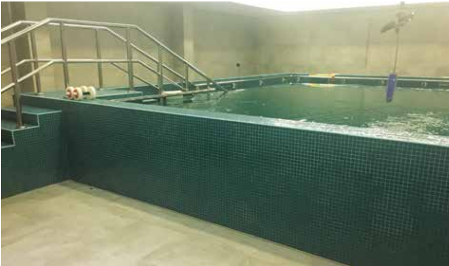
Auch in der Umgebung des Therapiepools wurde auf insgesamt rund 80 Quadratmetern die Antirutschbeschichtung aufgetragen.