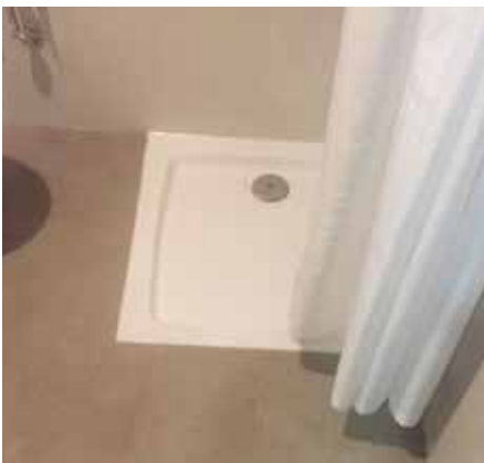
Im Rahmen der Renovierung wurden sämtliche Fußböden und flächigen Duschen von 120 Badezimmern mit der Antirutschbeschichtung von GriPSafetyCoatings sicherer gemacht.