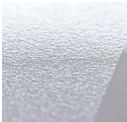
Die transparente Antirutschbeschichtung ist nur auf größte Nähe sichtbar und kann mit üblichen Bodenreinigern, Hochdruckreinigern und Saugbürstenmaschinen mühelos gereinigt werden.

tientenbädern seine besondere Berechtigung – denn tatsächlich gehört das Ausrutschen auf nassen Oberflächen zu den häufigsten Unfallursachen und stellt gerade im Klinikbereich ein hohes Risiko dar. Duschmatten sind keine Lösung, da sie keinen dauerhaften Halt garantieren. Im Gegenteil: Seifenrückstände und mechanische Abnutzung machen diese noch gefährlicher und unberechenbarer.