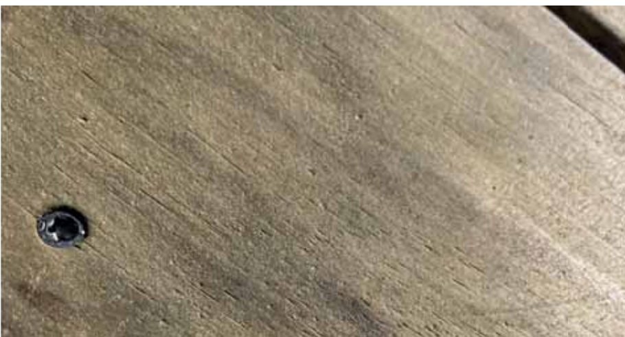
■ Eine Antirutschbeschichtung, die sich auch für Holz im Außenbereich eignet? Die Schweizer GriP Safety Coatings AG hat das passende Produkt.