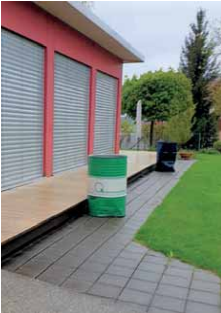
■ Die Accoya-Holzriemen auf der Terrasse erwiesen sich bei Regen, Nässe und Kälte als gefährliche Rutschbahn.

Beurteilung vor Ort einen guten Eindruck gemacht, also haben wir den Auftrag für die rund 70 Quadratmeter große Holzterrasse erteilt.“