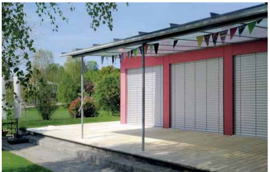
■ Die Gemeinde Worb im Schweizer Kanton Bern hat Vielfältiges zu bieten. Im Kindergarten Alpina werden rund 25 Kinder betreut.

Bei diesen Witterungsbedingungen war die Lage prekär. Ein Teppich erzielte nicht die gewünschten Ergebnisse, also wurde die Terrasse gesperrt.