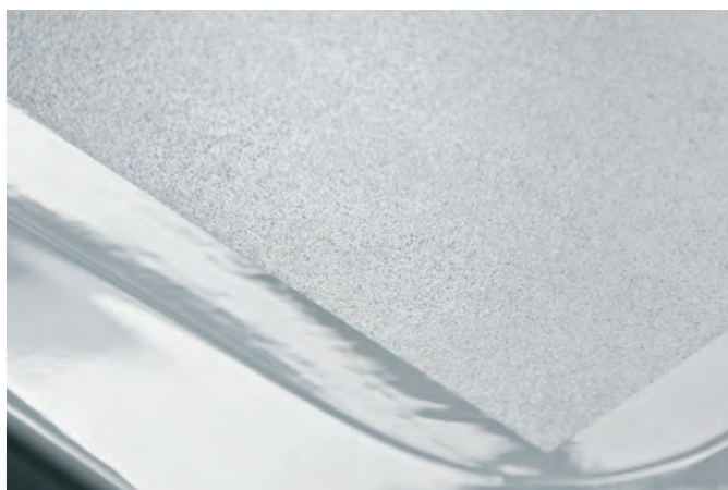
Revêtement GriP antidérapant® dans la baignoire. Rivestimento GriP AntiSlip® nel piatto doccia.