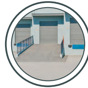
Rampes d'entrepôts rampe di carico