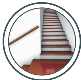
Les entrées, les escaliers Aree di ingresso, scale

SICUREZZA ALL'INTERNO E ALL'ESTERNO DELLA CASA CON GRIP ANTISLIP®.