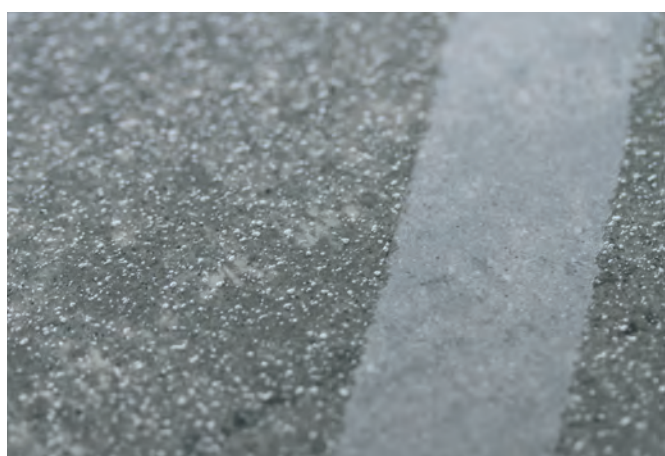
Revêtement GriP antidérapant® sur de la pierre. Rivestimento GriP AntiSlip® su pietra.