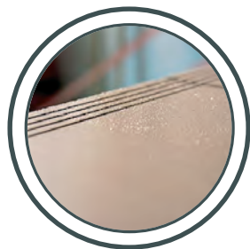
Escaliers, foyers Scale, atri

SICUREZZA NEGLI AMBIENTI PUBBLICI E INDUSTRIALI CON GRIP ANTISLIP®.