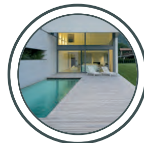
les piscines, les saunas piscine, sauna