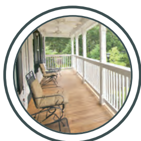
les vérandas verande