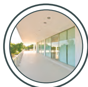
les balcons balconi