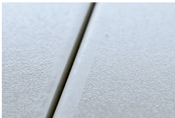
Revêtement GriP antidérapant® sur le carrelage du sol. Rivestimento GriP AntiSlip® su piastrella.