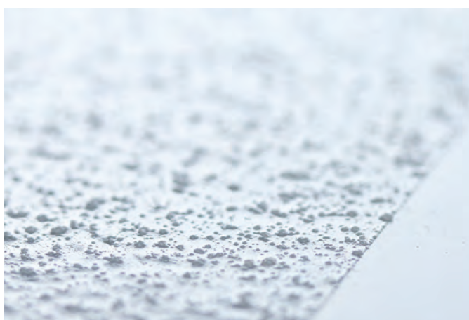
Revêtement GriP antidérapant® dans une granularité multipliée par vingt. Rivestimento GriP AntiSlip® ingrandimento 20x.