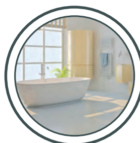
les baignoires, les douches vasche da bagno, docce