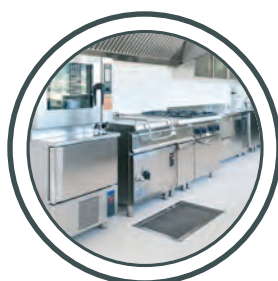
Cuisines, cantines cucine industriali, mense